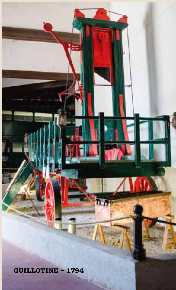
GUILLOTINE - 1794